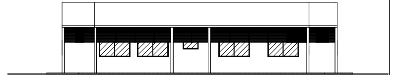
2 Fachada Norte ESCALA 1:75